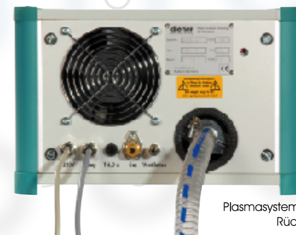
Plasmasystem Femto: Rückansicht